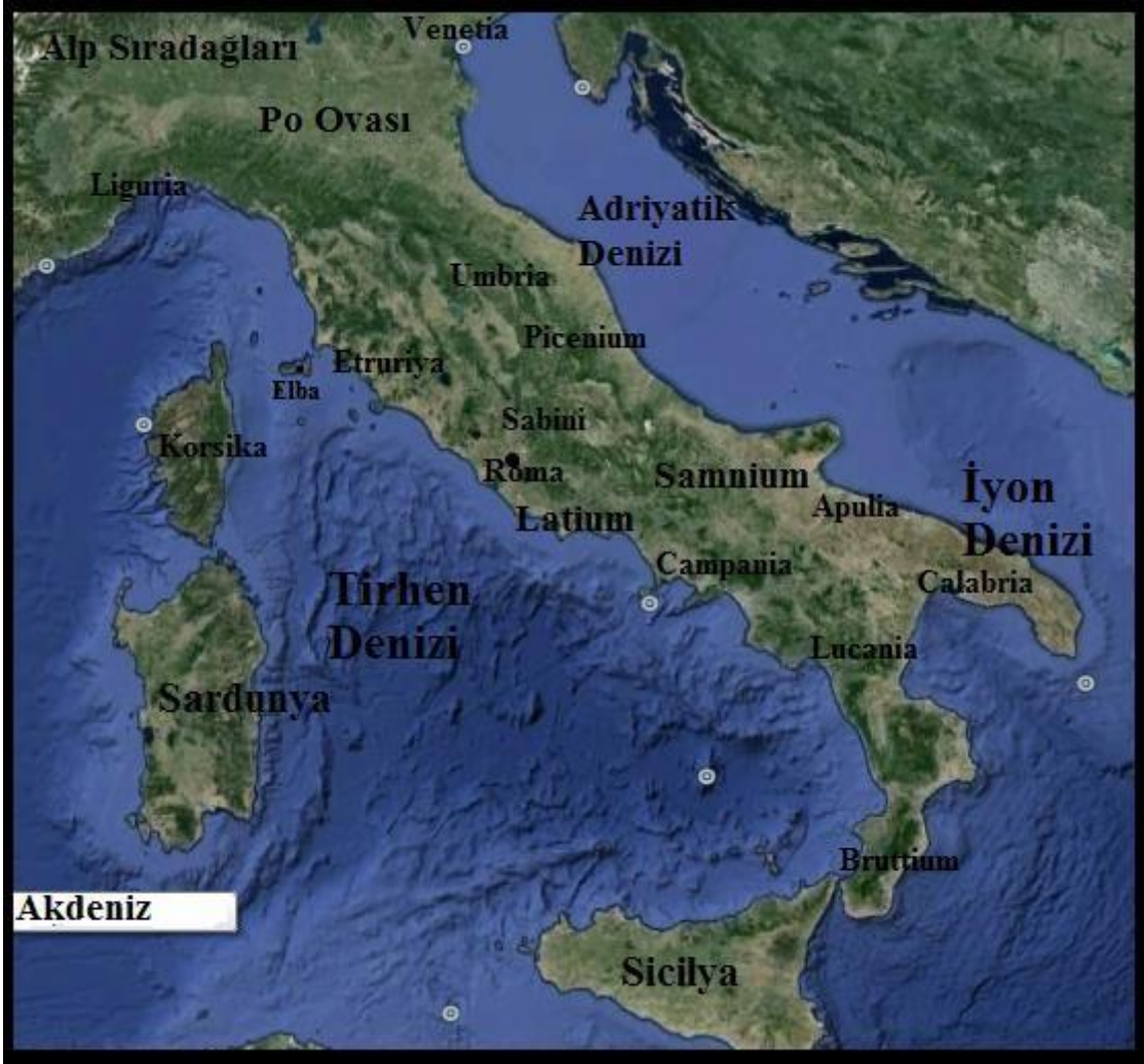
Ek.1. İtalya Yarımadası

https://www.kozmosungenetigi.org/wp-content/uploads/2021/08/resim_2021-08-01_020456.png