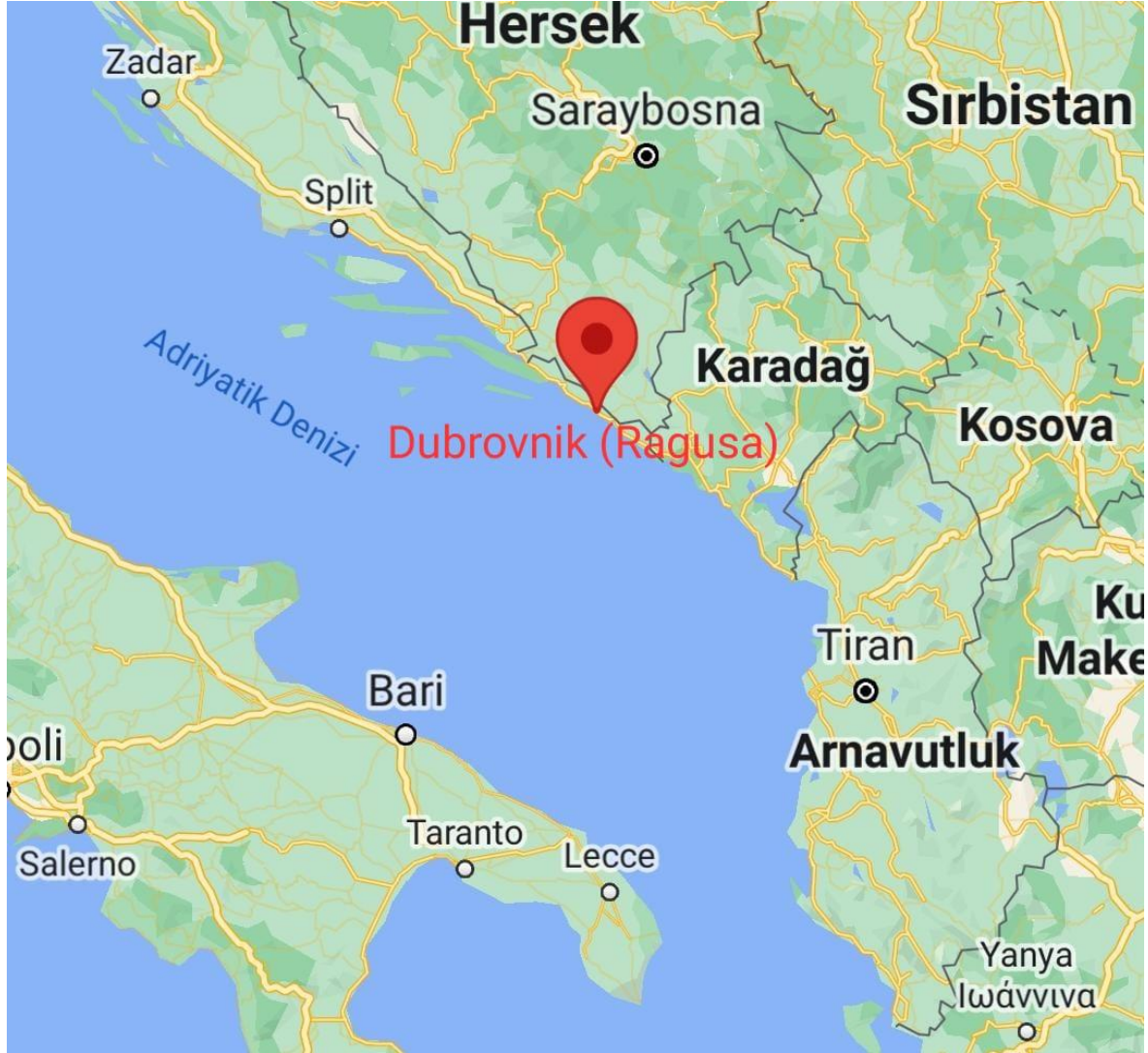
Ek.6. Ragusa (Dubrovnik) Şehri