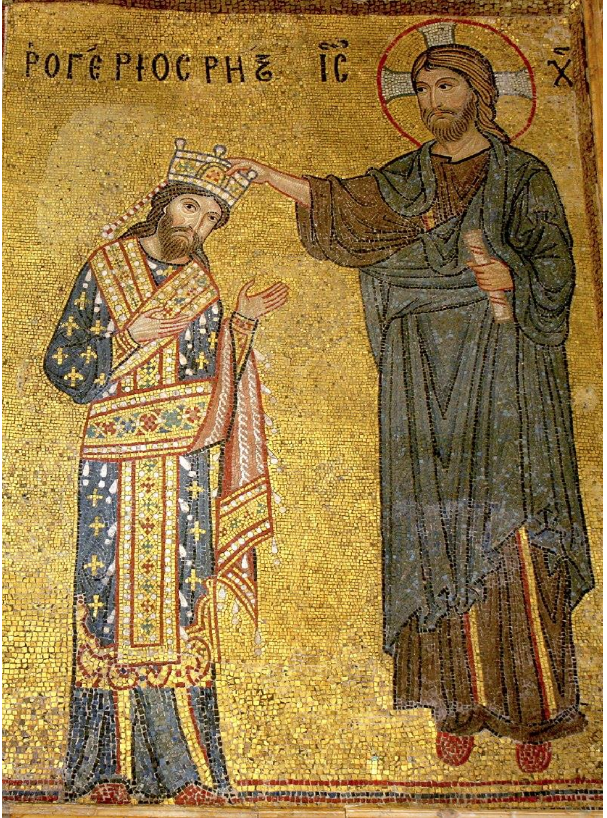
Ek.12. II. Roger'ın Taç Giyme Sahnesi (Martorana Kilisesi Duvarında Mozaikle İşlenmiş)

https://en.wikipedia.org/wiki/Roger_II_of_Sicily