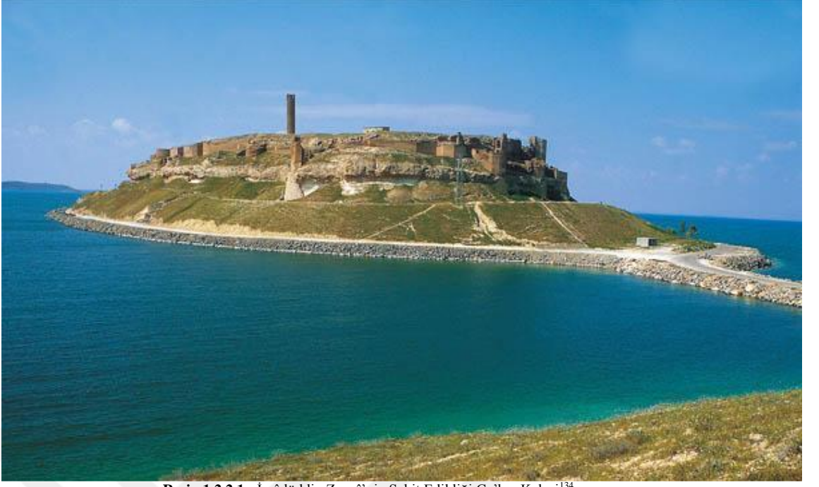
Resim1.2.2.1.: İmâdüddin Zengî'nin Şehit Edildiği Ca'ber Kalesi 134