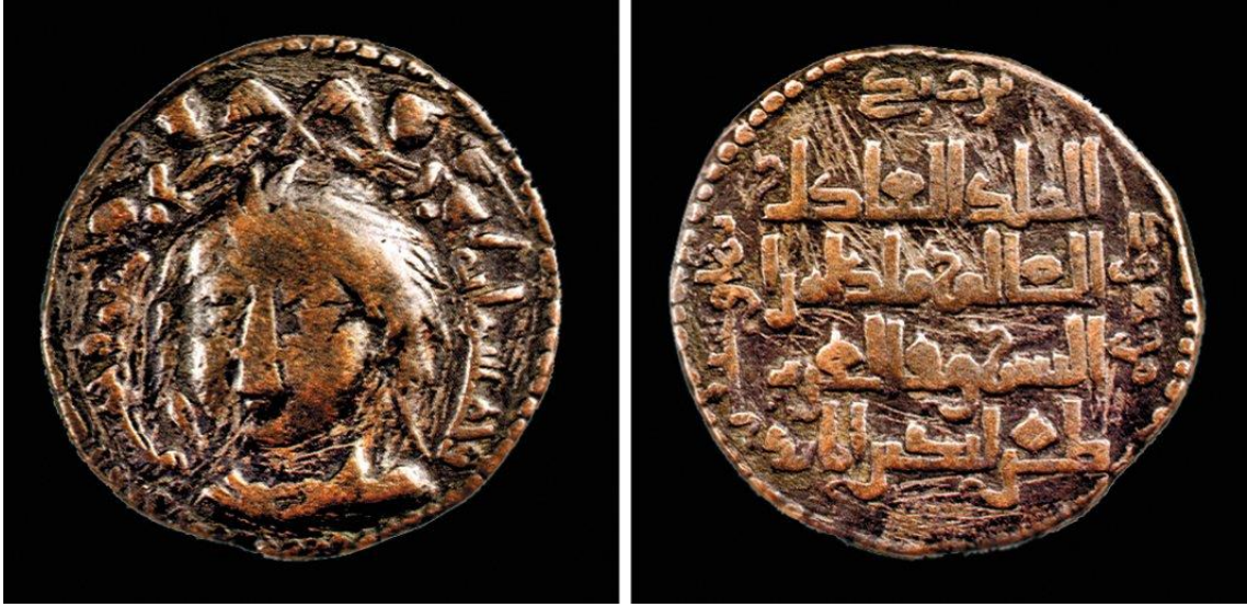
Resim 3.4.1.: Nureddin Mahmud Zengî Sikkeleri