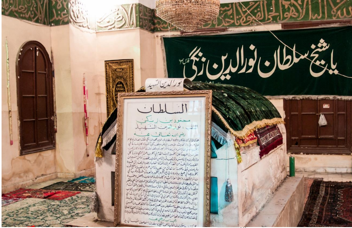
Resim 2.1.1.: Nureddin Mahmud Zengi'nin Kabri 166