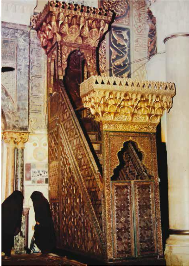
Resim: 3.5.1.1.: Mescid-i Aksa'dan Nureddin Mahmud Zengi Minberi 350

Nureddin Mahmud, Kudüs'ü Haçlılardan geri almak fikrini öyle bir benimsemiştir ki oranın kontrolünü sağlayacağı zamanı düşünerek Mescid-i Aksa için dönemin en değerli sanatçılarından el- Ehterani'ye bir minber yaptırmıştır. Yaptırdığı minber Kudüs fethedilene kadar Halep Ulu Cami'inde kalmış, Nureddin'in bu arzusunu Kudüs'ü Haçlılardan geri alan Selahattin Eyyubi yerine gerçekleştirmiş ve minberi Mescid-i Aksa'ya getirtmiştir. 349