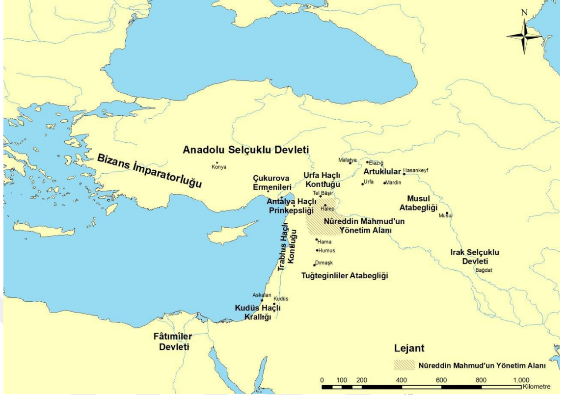
Harita:2.2.1.: Nureddin Mahmud İktidara Geldiğinde Siyasi Dengeler. 168

1146 yılında Nureddin Mahmud Zengî, Halep'e giderek bölgenin kontrolünü sağlamıştır. Nureddin Mahmud Zengî'nin Halep'i seçmesi konusunda babası İmâdüddin'in yakın arkadaşı Esedüddin Şîrkûh'un büyük bir payı vardır. 169 Selahaddin Eyyubî'nin amcası Esedüddin Şîrkûh, aynı zamanda Nureddin Mahmud'un askeri ve siyasi tecrübe kazanmasında yardımcı olmuş tecrübeli devlet adamıdır. Ayrıca iktidarının ilk yıllarında vezir Mücahidüddin Kaymaz verdiği destek ile Nureddin Mahmud'un yükünü hafifletmiştir. 170