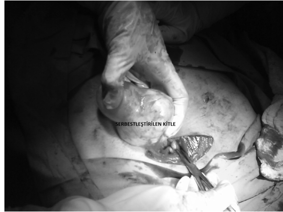
Resim 3. Laparatomideki görünüm.