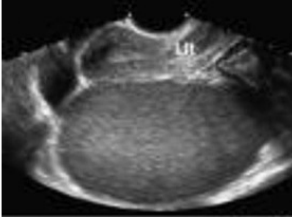
Resim 1. Olgunun preoperatif USG görüntüsü.

douglasa oturmuş çevre doku ile minimal yapışıklılar gösteren sağ tuba kaynaklı yaklaşık 10 cm boyutunda kitle izlendi (Resim 2). Asit gözlenmedi. Kitlenin tubal kaynaklı olması, olası malignite şüphesi ve kitleyi rüptüre etmemek için laparotomi kararı alındı (Resim 3). Laparotomi de her iki over ayırt edildi; sol tuba salim, sağ tuba kaynaklı kitle keskin diseksiyon ile serbestleştirildi. Kitle intraperitoneal idi. Tubal kaynaklı kitle kökünden klemlenerek tuba ile birlikte salpenjektomi yapılarak çıkarıldı ve frozen çalışılması için patolojiye gönderildi. Sonuç olarak, hidatik kist ile uyumlu görünüm geldi. Batın olası bulaşı ve yeni organ tutulumunu engellemek için rüptür olmasa da %20 NaCl ile yıkandı. Hasta postoperatif dönemde enfeksiyon hastalıkları ile konsülte edildi. Bu dönemde hastaya beyin, toraks ve batın tomografisi çekildi fakat hiçbir primer odak saptanamadı. Abdominal tomografide sağ renal agenezi izlendi. Enfeksiyon hastalıklarının önerisi ile albendazol tedavisi başlandı ve postoperatif 2. gününde hasta taburcu edildi.