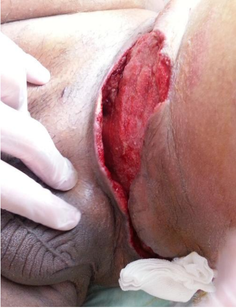
Resim 3: Ardışık debritlemeler sonrası elde edilen sağlıklı ve kapanmaya hazır yara