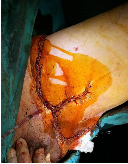
Resim 4: Flep yöntemi ile yaranın kapatılması