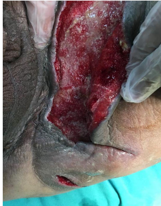
Resim 2: Debritleme sonrası sağlıklı doku ve granülasyonun oluşumu