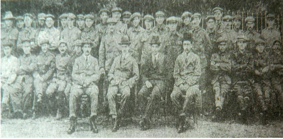
İngiliz ve Fransız esirleri toplu halde