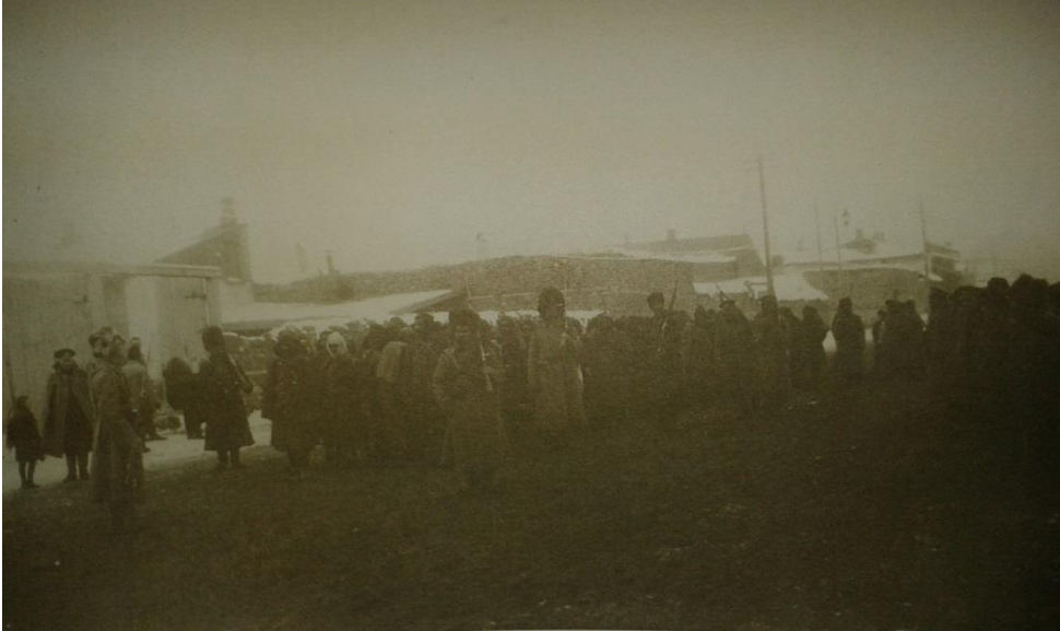
Türk Esirleri Kars Aleksandır Caddesi Ocak 1915