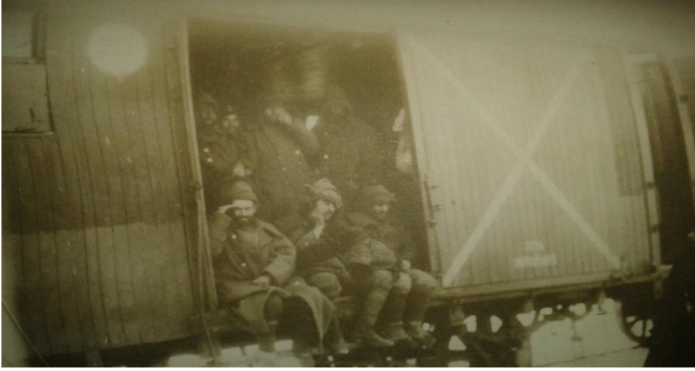
Türk Esirlerinin Nakli 1915