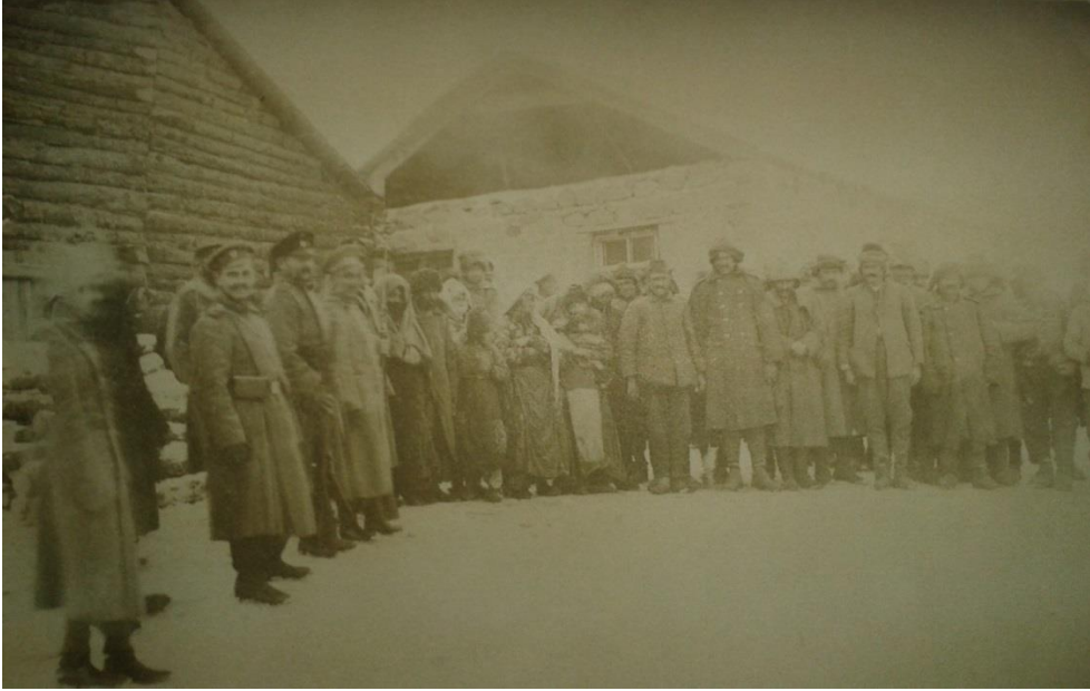
Sarıkamış Cephesinde Türk Esirleri 1916