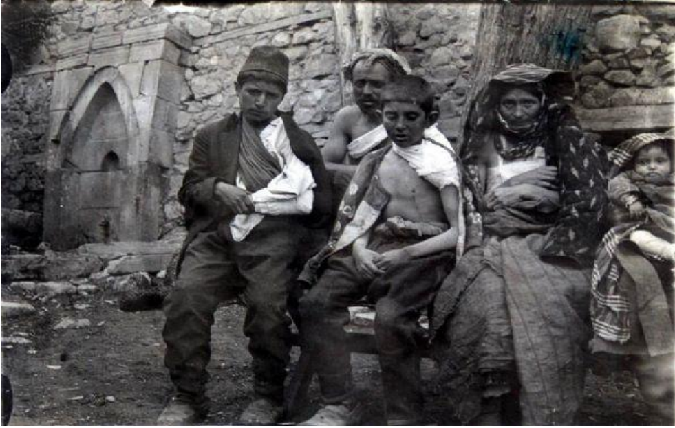
I.Dünya Savaşı Doğu Cephesindeki Türk Mülteciler