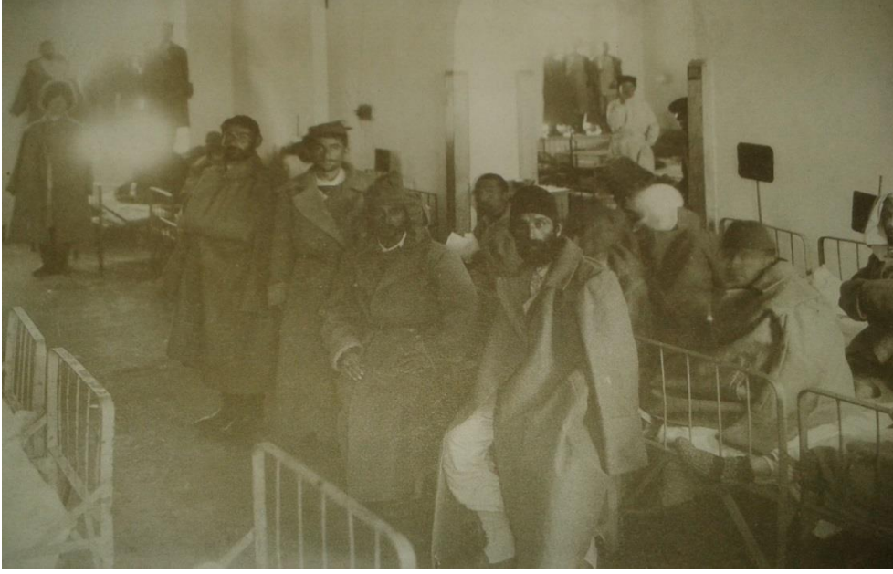
Kars Askeri Hastanesinde Türk Esirleri 1915