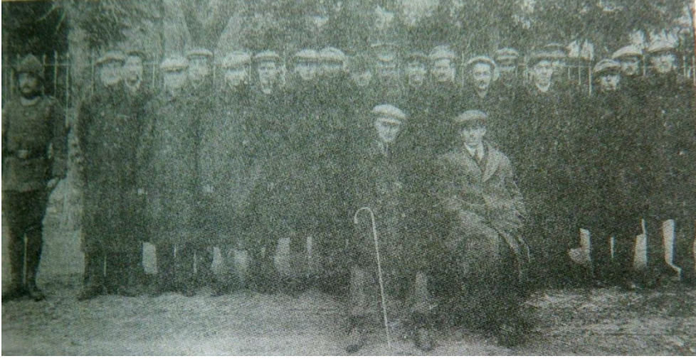
İngiliz Denizaltı'sı esir mürettebatı