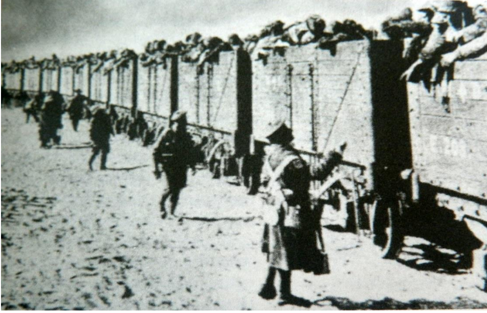
Trenle nakledilen Türk esirleri